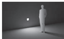
Éclairage à diffusion libre